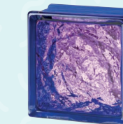
MG/s SOPHISTICATED RUBY