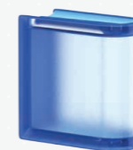
MG/s MINI LINEAR END 14,6x14,6x8 CM