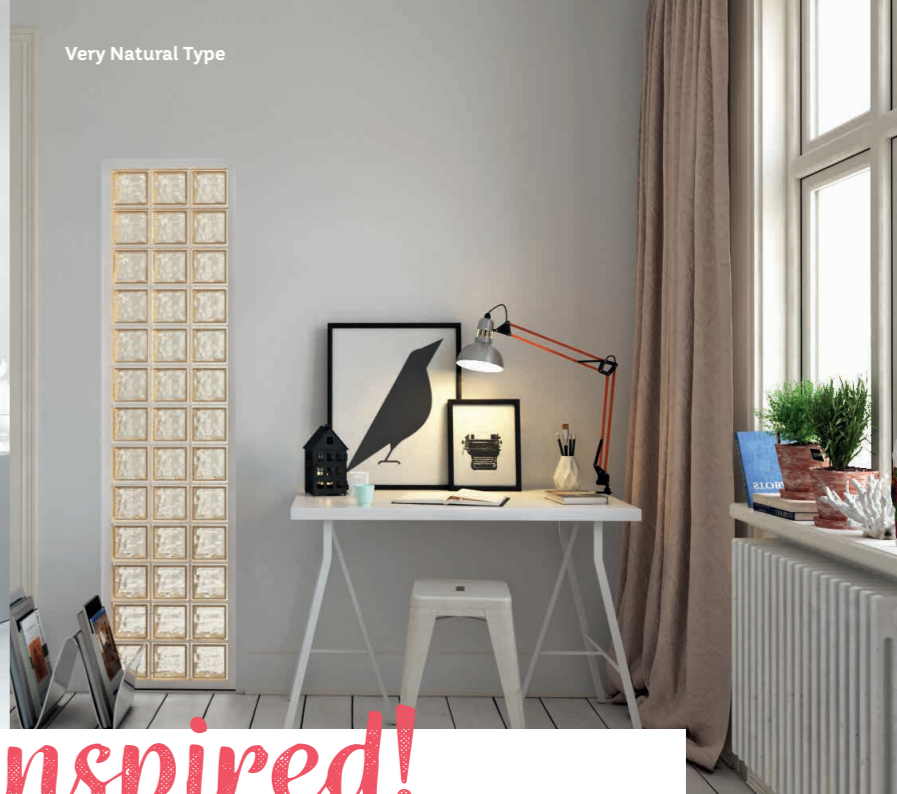
Very Natural Type