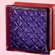
MG/s ROMANTIC VIOLET