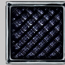
COLORED BAND: BLACK 14,6x14,6x8 CM