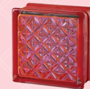
MG/s ROMANTIC PINK