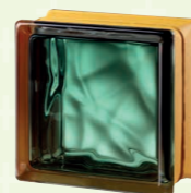
MG/s VEGAN EMERALD