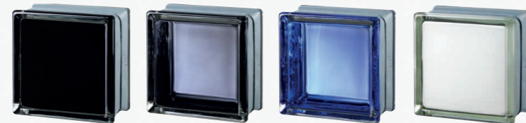
MG/s FUTURISTIC BLACK 100%