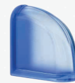
MG/s MINI CURVED END 14,6x14,6x8 CM