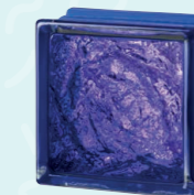
MG/s SOPHISTICATED VIOLET