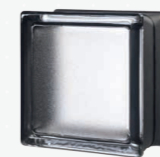
MG/s MINI LICORICE