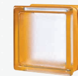
MG/s MINI APRICOT