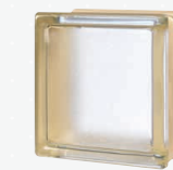
MG/s MINI VANILLA