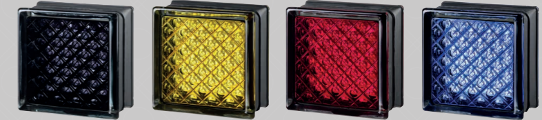
MG/s DAREDEVIL BLACK 100%