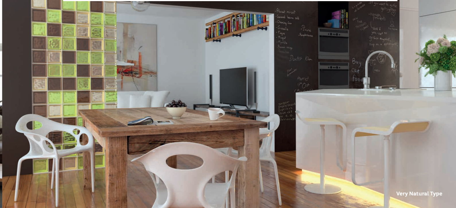
Very Natural Type