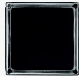
COLORED BAND: METALLISED 14,6x14,6x8 CM