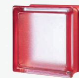
MG/s MINI CHERRY