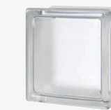
MG/s MINI ARCTIC