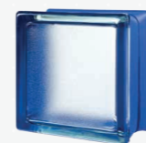
MG/s MINI BLUEBERRY