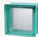
MG/s MINI MINT