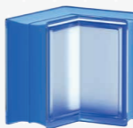
MG/s MINI CORNER 14,6x14,5x8 CM