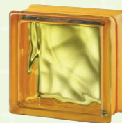
MG/s VEGAN YELLOW