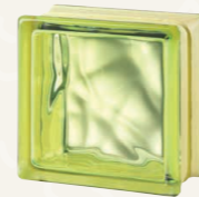
MG/s VERY NATURAL GREEN