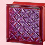
MG/s ROMANTIC RUBY