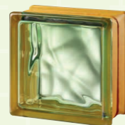
MG/s VEGAN GREEN