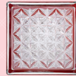
COLORED BAND: RED 14,6x14,6x8 CM