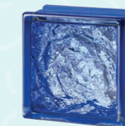
MG/s SOPHISTICATED BLUE