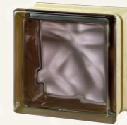
MG/s VERY NATURAL BRONZE