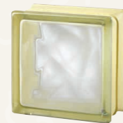
MG/s VERY NATURAL WHITE 30%