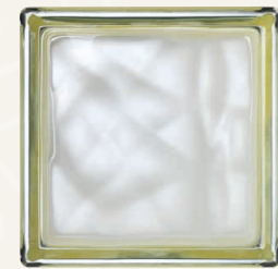
COLORED BAND: VANILLA 14,6x14,6x8 CM