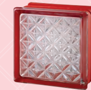
MG/s ROMANTIC WHITE 30%