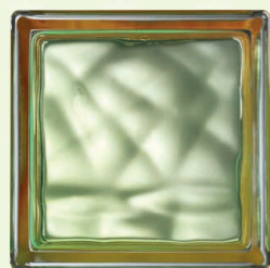
COLORED BAND: ORANGE 14,6x14,6x8 CM